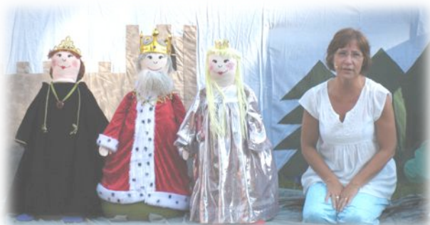
Den sista draken.

Så har vi åter lagt en sommar fylld med arbete och aktiviteter på Västerfärnebo Gammelgård till handlingarna. Säsongen har innehållit både traditionella program och nya inslag. Särskilt positiv blev familjekvällen med dockteatern "Den sista draken" och medverkan av Svenska Grälleklubben.