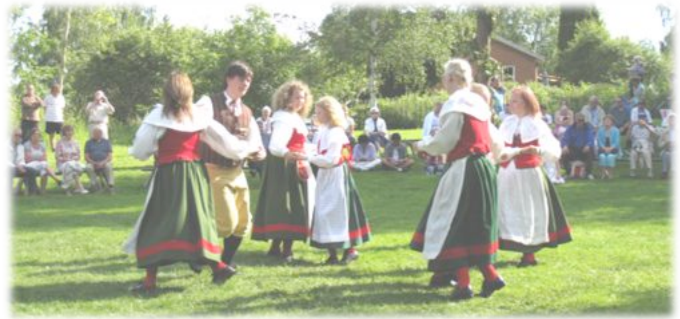
Midsommarfirande på Gammelgården med dansuppvisning av Ångsklockorna.