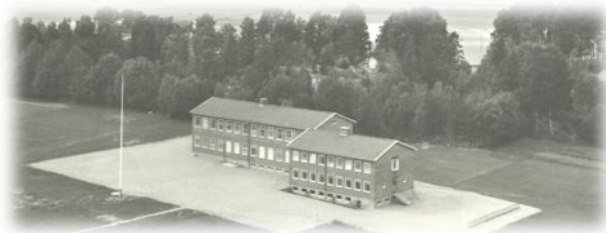
Västerfärnebo Centralskola byggd 1952.