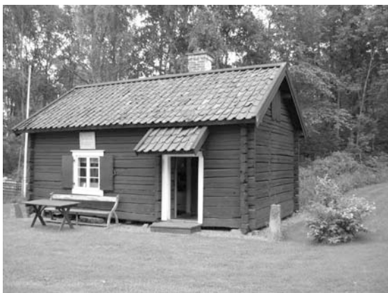
Soldatstugan från Norr Gerdsbo.

Soldatstugan. En äkta sådan från Norr Gerdsbo för soldat N:o 103 Norgren å Livkompaniet, som den gamla tavlan ovan fönstret upplyser om. Inne i stugan lägga vi märke till den äkta rotekistan, i vilken förr soldatens uniform förvarades mellan mötena. I kistans lädika finns nu några gamla soldatkontrakt.