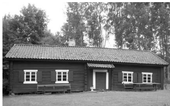
Mangårdsbyggnaden från 1798.

1760 instämplat. Märkligast är det stora, tredubbla låset, men nycklarna har förkommit.