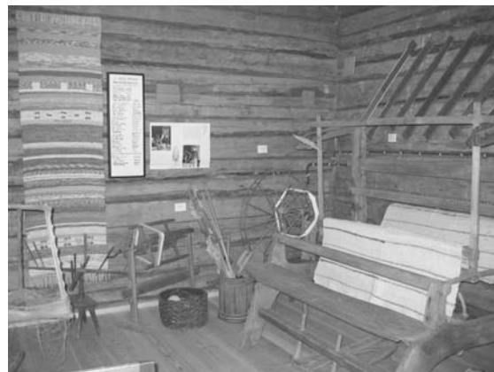
Temautställning om vävning på logen hos Möklinta Hembygdsförening.

Sveriges Hembygdsförbund och Genline AB har inlett samarbete mellan hembygdsforskning och släktforskning. Information finns på www.bygdeband.se och www.familjeband.se . Kurser kommer att hållas om hur man kan lägga in material i Bygdeband.