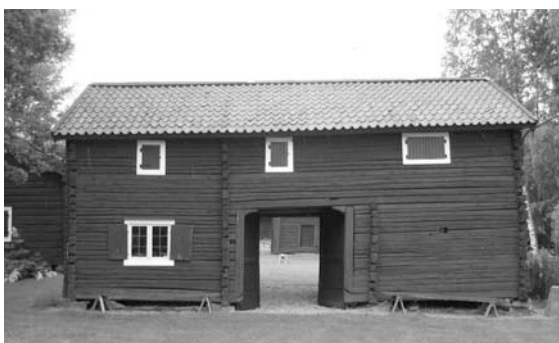
Vi träder in genom portlidret.