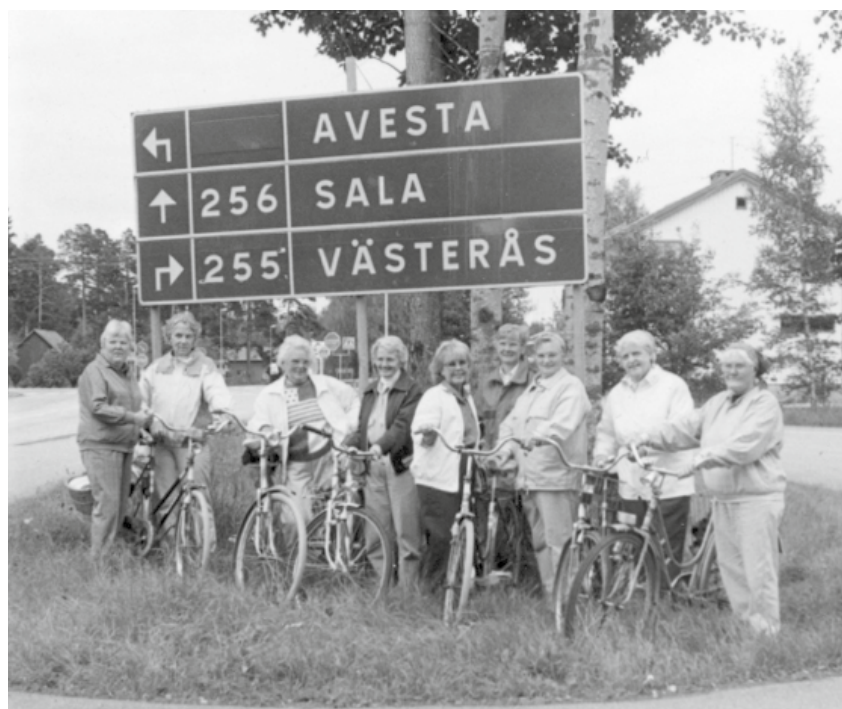
Cyklande damer i Salbohed.