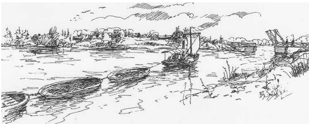
Ångbåten Svanen stävar söderut i Svartån från Hörnsjöfors Bruk och närmar sig Vangsbron. Lasten består av tackjärn från Norberg som ska till Svanå Bruk. (Teckning av Bo Svärd).

ditionella bilden av Västmanland. Vi söker Svartåns själ, vi tittar djup ner i det brungrumliga vattnet och funderar över vilket inflytande vattnet har haft på oss. Kräftor, musslor och snäckor lever där. Och Gammelgäddan, den som alla sett och pratat om men som ingen lyckats fånga.