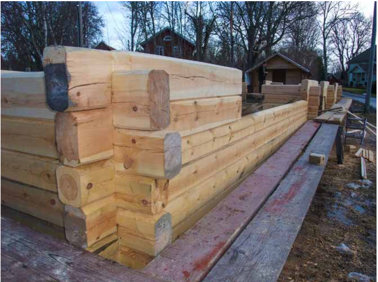
Knuttimring är ett precisionsjobb som kräver stor hantverksskicklighet.