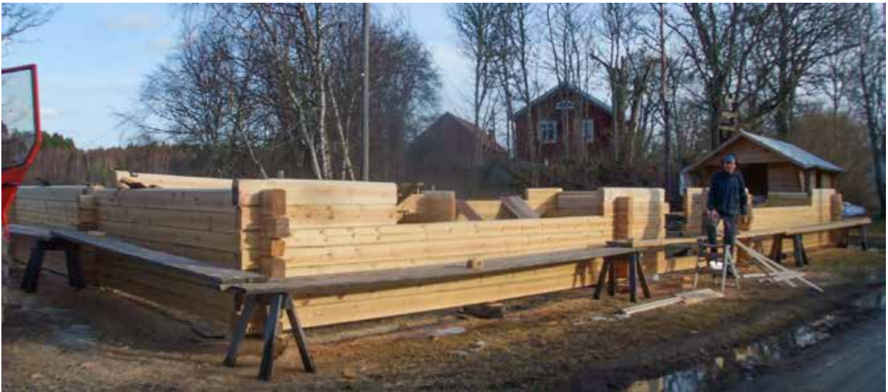
Här ses timmerstommen i sin fulla längd.