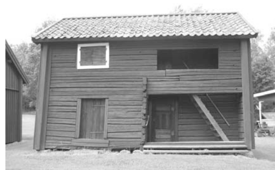
Nybyboden, första byggnaden på Gammelhärd, inköpt 1919 för 500 kronor.

Portliderbyggnaden innehåller på nedre botten gårdskammare och matbod. I den senare finns bl.a. en hemkvarn samt olika måttsatser för våta och torra varor m.m. Övre våningen som har svalgång, upptagas av två små dräng- och pigbodar i ursprungligt skick samt en större, inredd till utställningsrum.