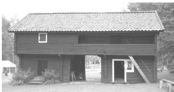
Portlider från Hedbo.

Portliderbyggnaden innehåller på nedre botten gårdskammare och matbod. I den senare finns bl.a. en hemkvarn samt olika måttsatser för våta och torra varor m.m. Övre våningen som har svalgång, upptagas av två små dräng- och pigbodar i ursprungligt skick samt en större, inredd till utställningsrum.