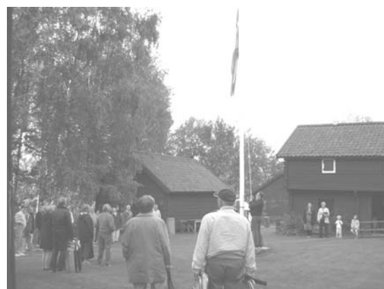
Flaggan firas sakta ner efter sommarkvällens festligheter.

beroende på att den haft sin plats invid trumslagarkasernen i Salbohed, dels därför att den är kort med antydning till huvud och axlar. Den skall lyftas med en hand på rak arm, varvid fingrarna gripa in i vissa håligheter, som kallas ögon och öron. En gammal bonde, som i sin ungdom varit med om detta styrkeprov, vitsar att det beror mindre på styrkan än fattningsgåvan . Hemligheten ligger nämligen däri, att endast vänstra handens fingrar finna bekvämt tag om stenen; den högra, som den om förhållandet okunniga helst använder, får intet tag om den. Dyliga lekar och styrkeprov övades förnämligast på tredje dagen av de stora bröllopsgästabuden.