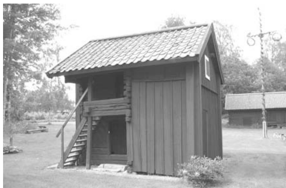
Visthusbod från Sör Åhl, gåva från Wirsbo Bruk 1928.

aktansvärd, likaså två grant utstyrda dopdräkter. Det andra och större rummet i denna våning är det på utställningsföremål rikhaltigaste. Först påträffa vi den 80-90 nummer stora samling stenåldersfynd av olika typer; en pilspets av skiffer har bland fackmän väckt särskilt uppseende. Så följer grupper av föremål rörande belysning, bordskärl, korgarbeten, dryckeskärl, ostformar, kaveldon, träbetsman m.m.